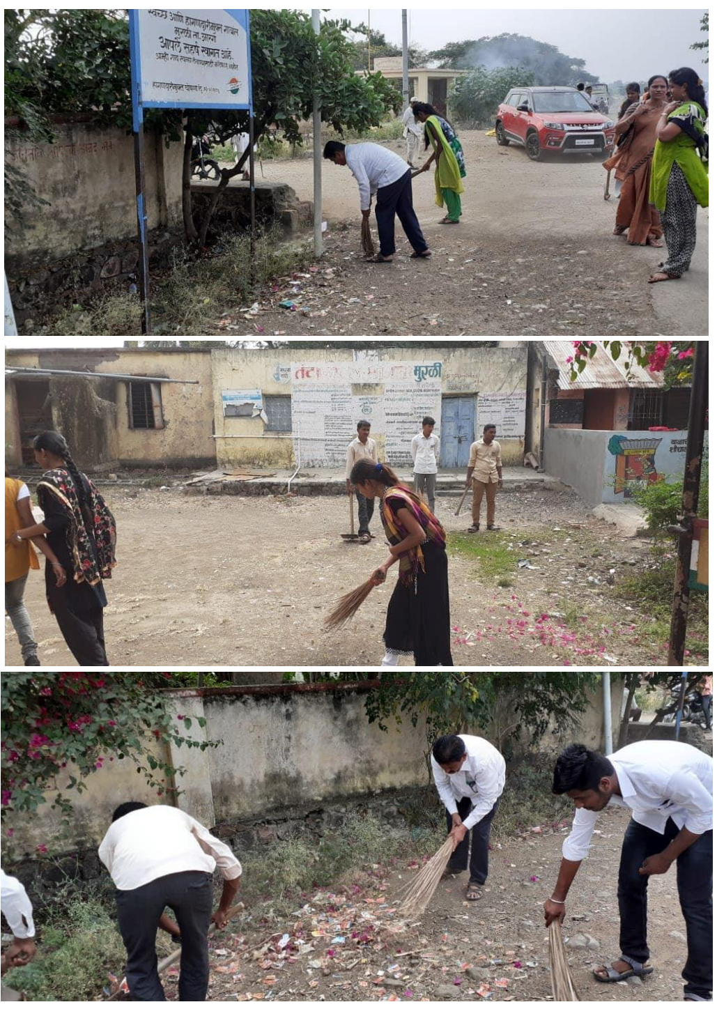
Cleanliness activities during the camp