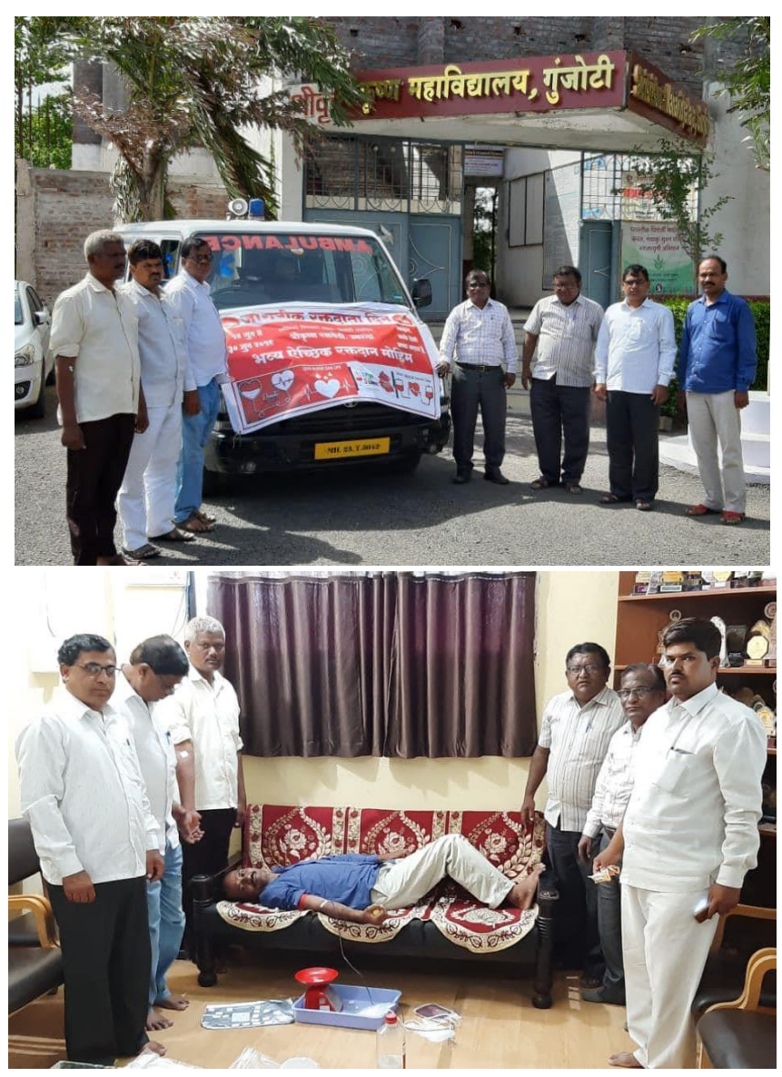
Blood Donation Camp

• Between the dates, 24.12.2019 to 30.12.2019, a one week special camp of NSS students was organized at Murali, Tq. Omerga Dist. Osmanabad. Several activities were conducted and implemented by the NSS volunteers within the seven days special camp. The activities were Health checkup, Voter awareness, No Tobacco Campaign, HIV awareness, Water conservation, Cultural activities and cleaning campaign. Nearly 150 student volunteers were participates in the camp.