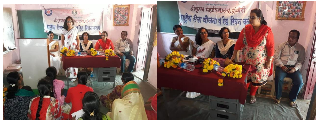
NSS and Red Ribbon club activity